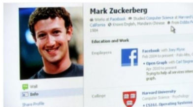
RICERCA SFATA FALSI...