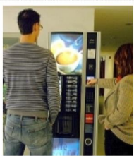
RICERCA, LA PAUSA CAFFÈ È...