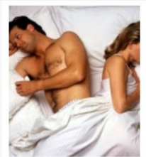
SESSO, CALO DELLA LIBIDO: USATE LO...