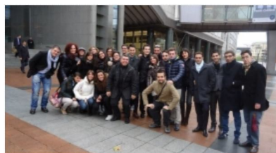
L'OCSE BOCCIA GLI...