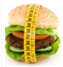
DIETA, BASTANO 30 MINUTI DI...