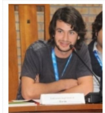
OREZZI (UDU): TEST IRREGOLARI,...