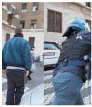
MANGANELLÒ STUDENTE, RINVIATO A...