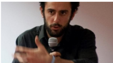
TASSE IN AUMENTO,...