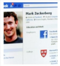
RICERCA SFATA FALSI MITI SU...