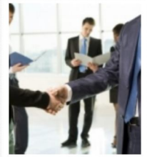
MIUR: FONDAZIONI UNIVERSITARIE...