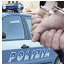
Aggredisce vicino di casa con una mazza da baseball: arrestato