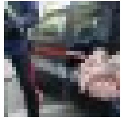
Calci e pugni contro la convivente: arrestato un 39enne