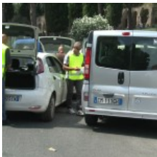
Abusivismo, Polizia locale: "Controlli su Ncc, taxi e servizi ai turisti"