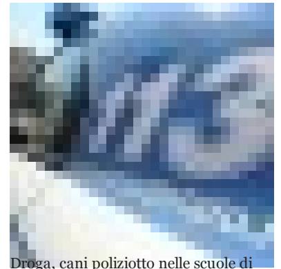
Droga, cani poliziotto nelle scuole di Cassino: controlli e sequestri