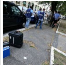
Agguato in periferia: gambizzato un 24enne, caccia a 2 uomini su uno scooter

Fatti trovare con la pubblicità di Google.