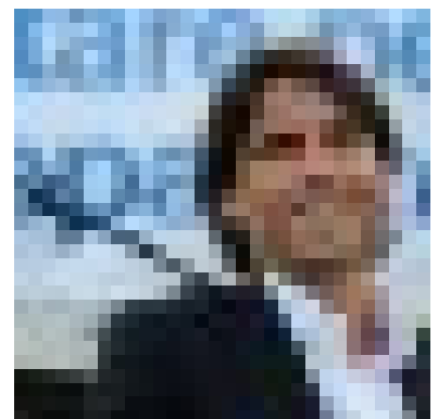
Affittopoli, Onorato: "Lo scandalo continua e Marino lo nasconde"